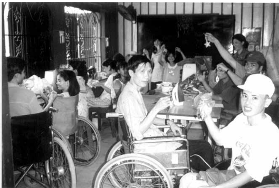
Maison Chance, atelier de production des étoiles