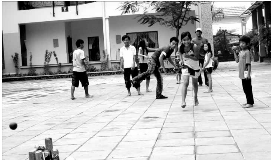
La cour centrale du Village sert aussi de place de jeux pour les élèves de l'école primaire.

• Informations et bulletin d'inscription à la page 4