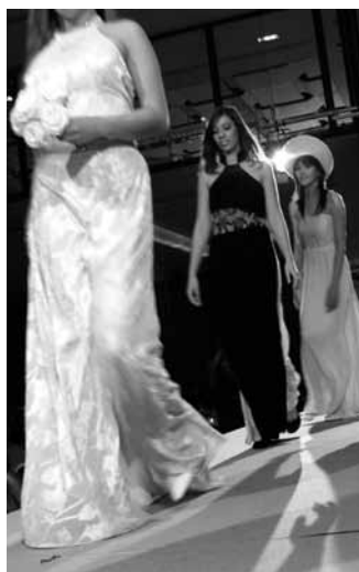
Défilé de mode de la fête 2009 à Genève.

Au programme de la fête: amitié et convivialité autour d'un repas vietnamien. La présentation