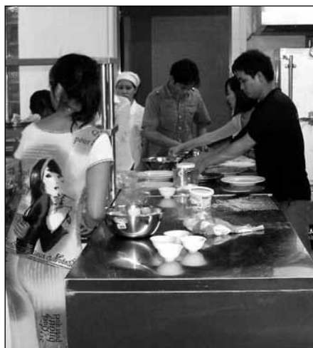
Les cuisiniers en formation dans la cuisine du futur restaurant de Maison Chance.