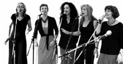
Les Evening Sisters