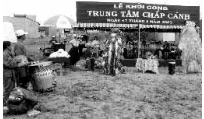
Centre Envol, 17 mai avant 10 heures: la danse des dragons

Le nouveau centre comprendra cinq classes d'alphabétisation à l'étage; la superficie des salles sera de 54 et 74 m 2 . Les bureaux de la direction et des professeurs ainsi que trois chambres pour accueillir les volontaires étrangers seront aussi à l'étage. Au rez-de-chaussée se trouveront quatre ateliers de formation professionnelle, un de couture, un de dessin, un de travail sur bois (bambou) et le quatrième d'informatique (pour les plus handicapés). Une salle