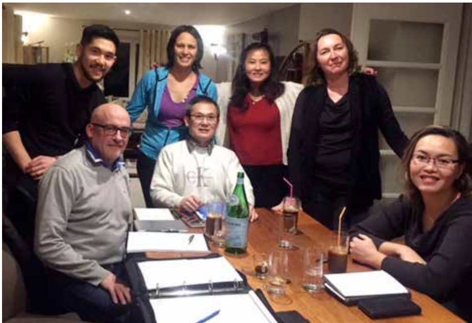
Membre du comité de Maison Chance Suisse: