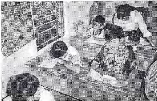
L'école de la Maison Chance accueille déjà d'autres enfants.

Avant d'attaquer le projet de transformation, il est aussi envisagé de créer en un premier temps un espace de production pour eux dans le futur centre de formation. Je pourrai continuer à vous parler des deux autres projets en prépa-