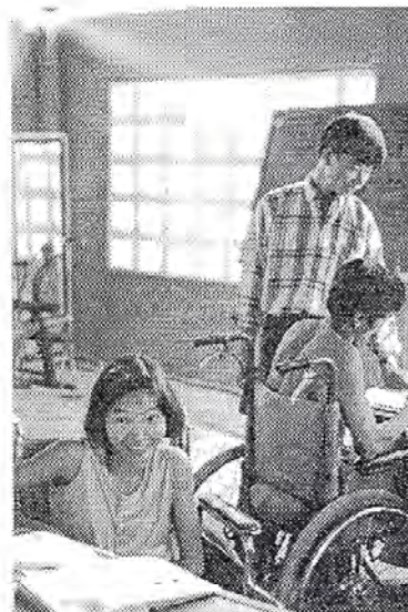
Se construire un avenir

La classe de couture a démarré depuis plus de six mois. Jusqu'à ce jour nous n'avions pas de salle. Pour régler le problème provisoirement, nous avons condamné le grand portail et y avons construit une nouvelle classe en prenant sur l'espace de notre cour. Notre foyer abrite plus de quarante personnes, et depuis que les cours professionnels ont