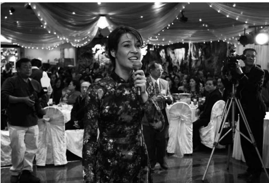
Sidney: des Vietnamiens d'Australie décidés à soutenir le projet du Village Chance