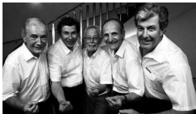
Les Morning Fellows