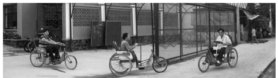
Sortie du Centre Envol. Le xe-lac est un tricycle pour handicapé qu'on fait avancer en tirant et en poussant le volant.